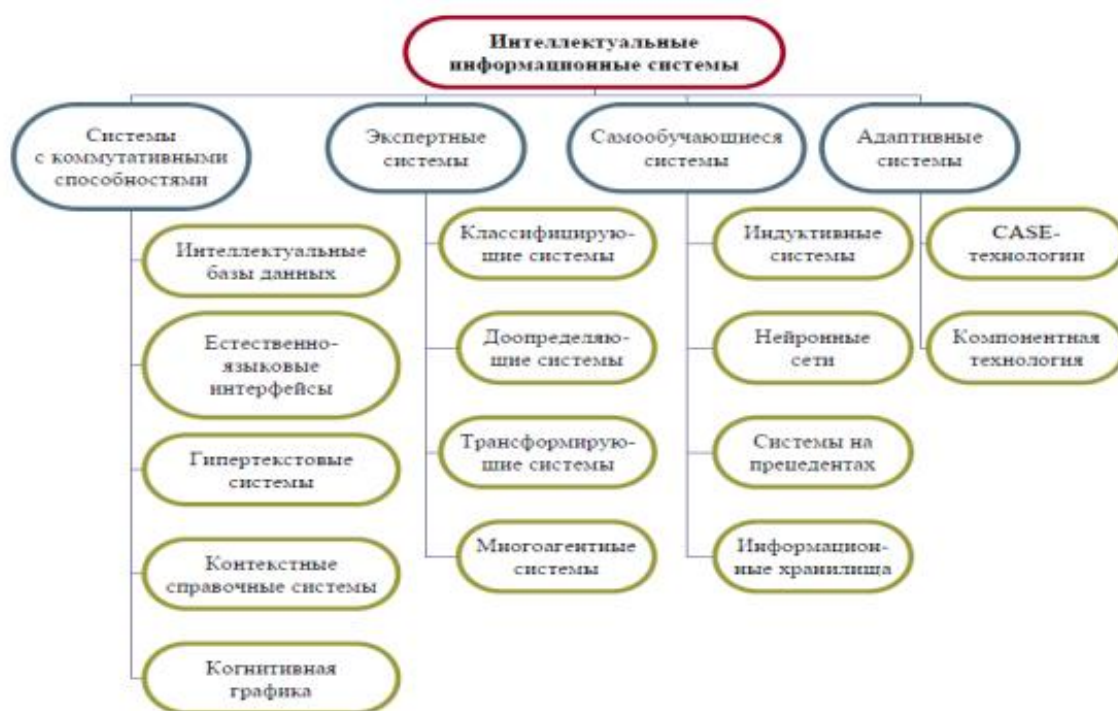
Рисунок 1. – Классификация интеллектуальных информационных систем по ...

2. На рисунке 2 приведен тип сети для предложения типа «Поставщик осуществил поставку изделий для клиента до 1 июня 2010 года в количестве 10 000 штук». Определите, тип данной сети.