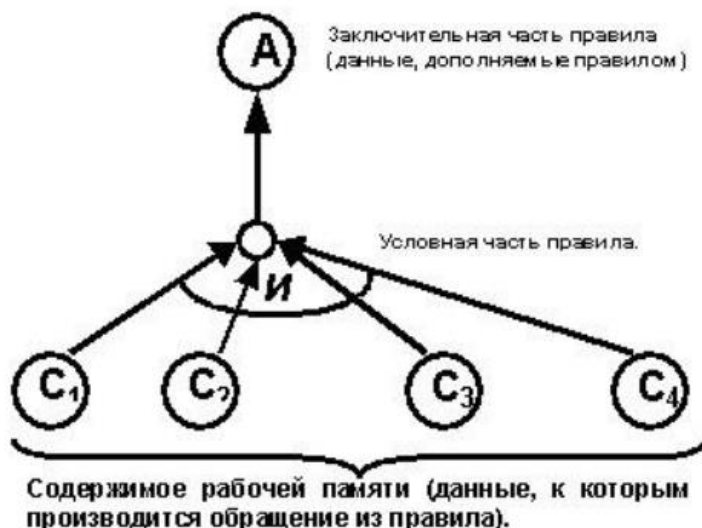
Рисунок 4 – Представление правила графом “...”.

5. Определите с помощью какого графа можно представить вывод если существует множество правил, из которых выводится одно и то же заключение. В самом нижнем узле этого графа будут располагаться основные системные данные, а в самом верхнем узле – выводимые системой заключения (рис. 4). Дайте полный ответ: «С помощью одного графа ...».