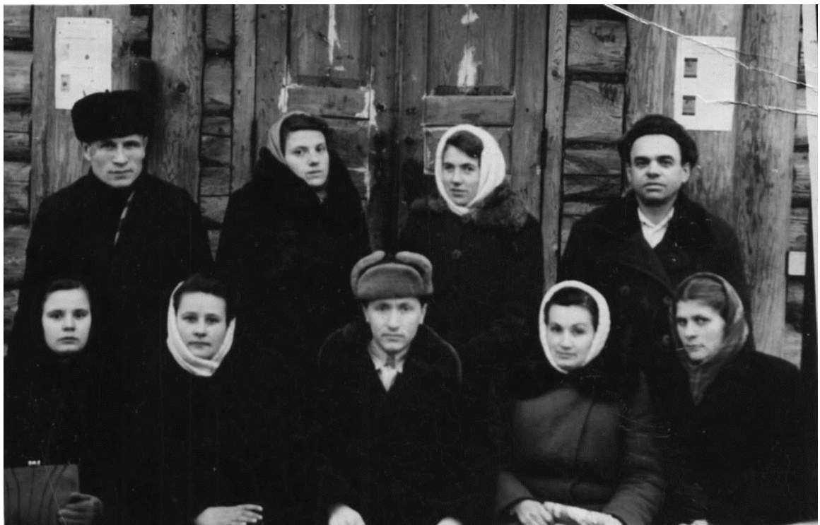
Директор Карамышевской машинно-тракторной станции Псковской области, 1954 г.