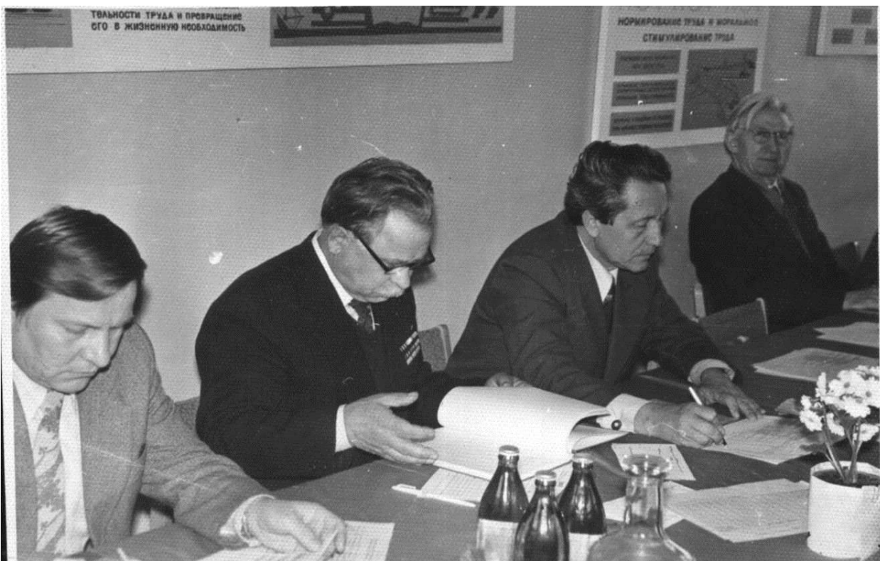
Председатель Государственной комиссии экономического факультета ТСХА, 1993 г.