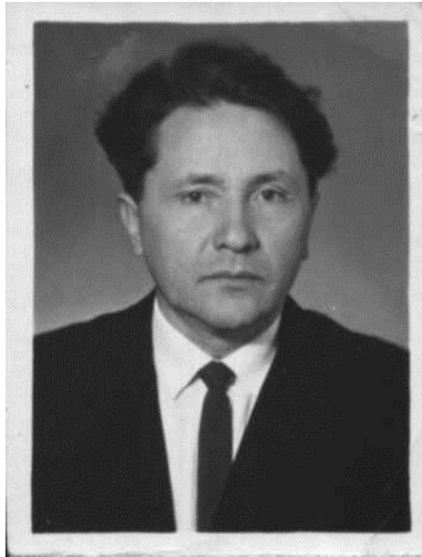
Студент ВСХИ, 1951 г.