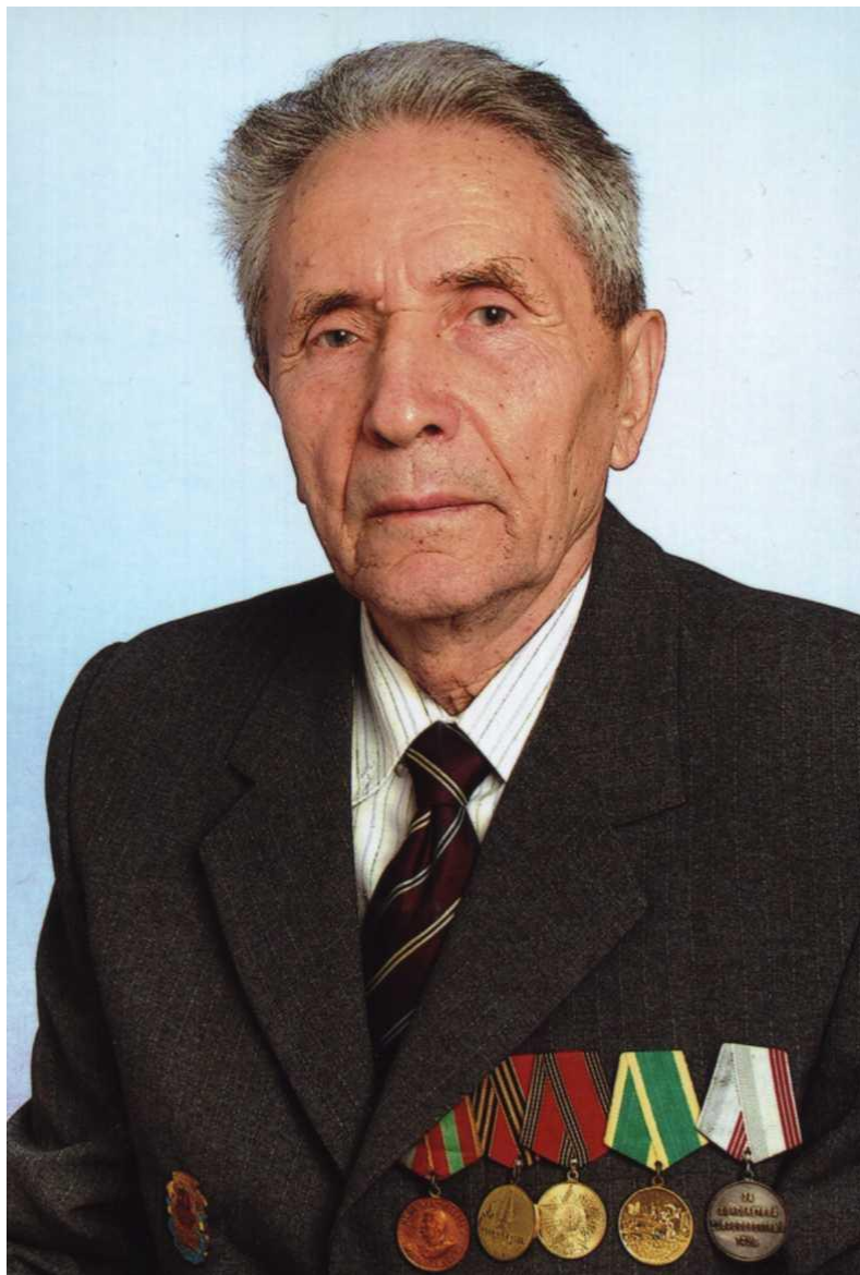
Доктор экономических наук, профессор