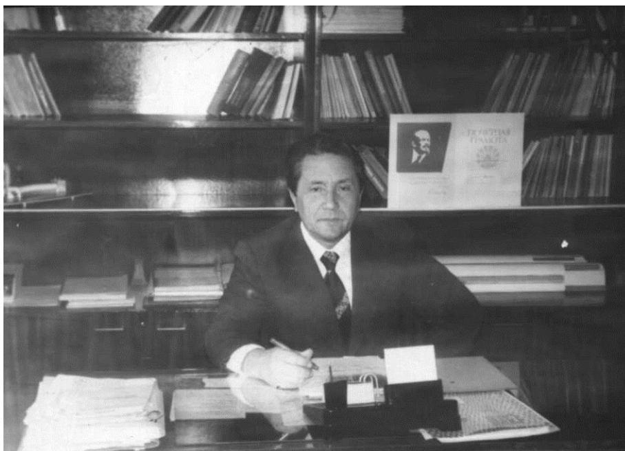
Заведующий кафедрой статистики и экономического анализа