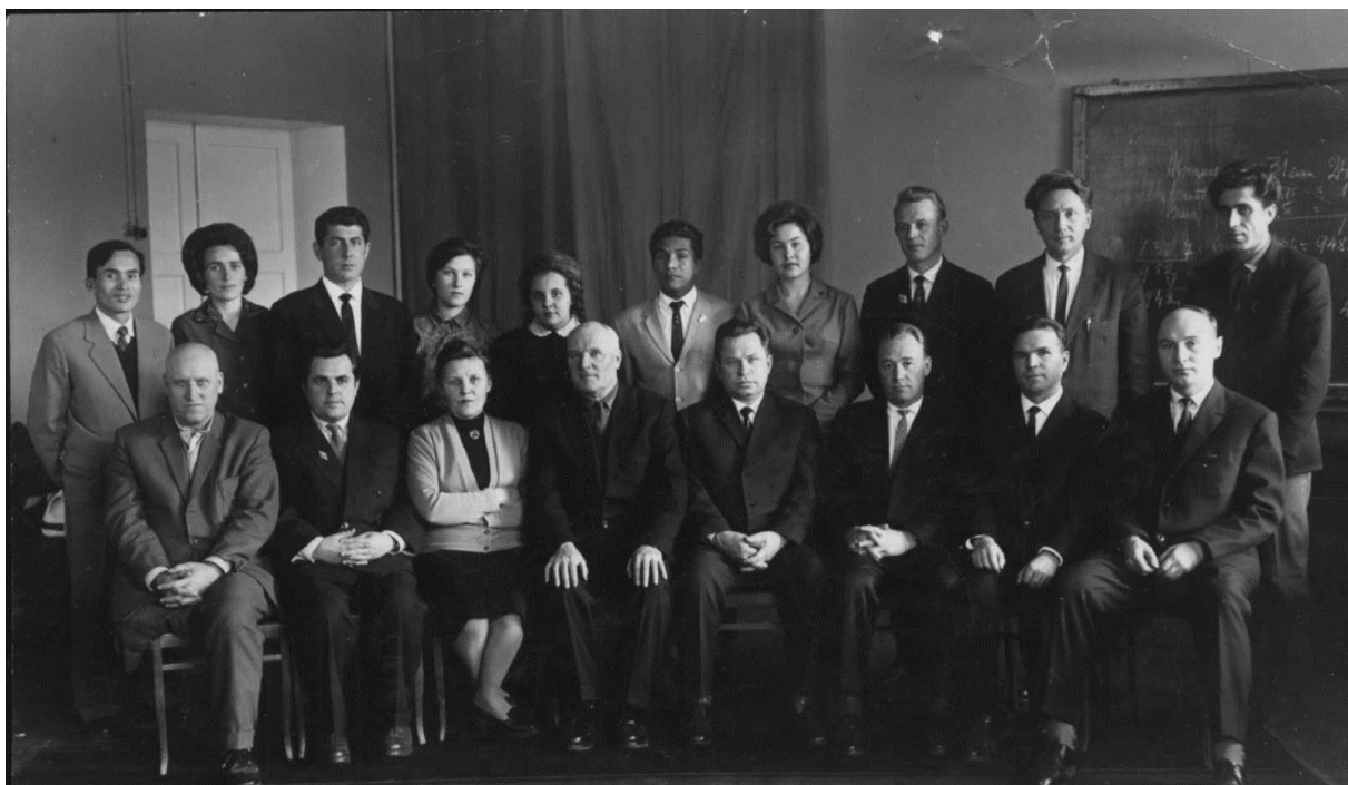
Аспирант московской с.-х. академии им. В. А.Тимирязева, кафедра экономики, 1958 г.