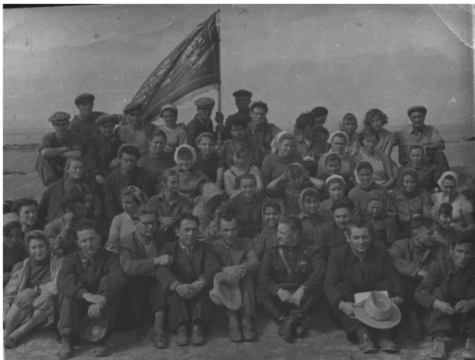
Казахстан. Руководитель отряда студентов экономического факультета на целине (преподаватели и студенты экономического факультета) 1956 г.