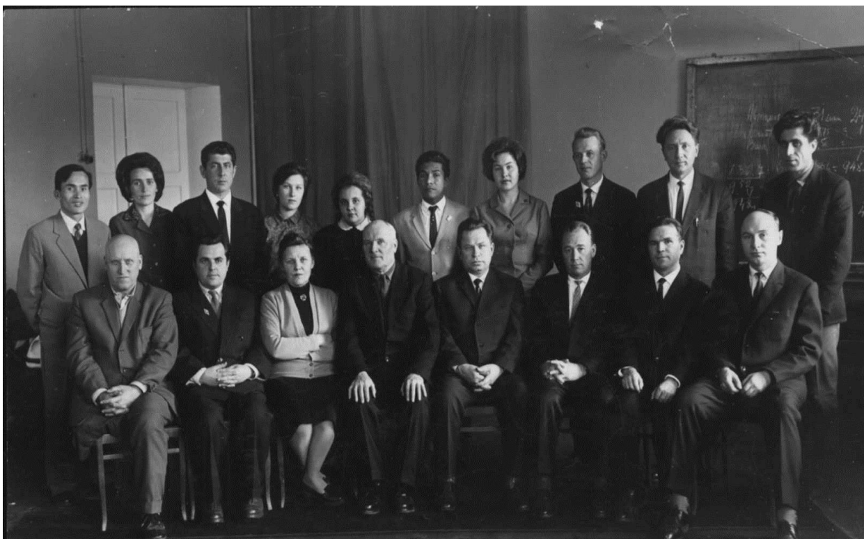
Всесоюзный семинар заведующих кафедрами статистики сельскохозяйственных вузов СССР на базе кафедры статистики экономического факультета Луганского сельскохозяйственного института.