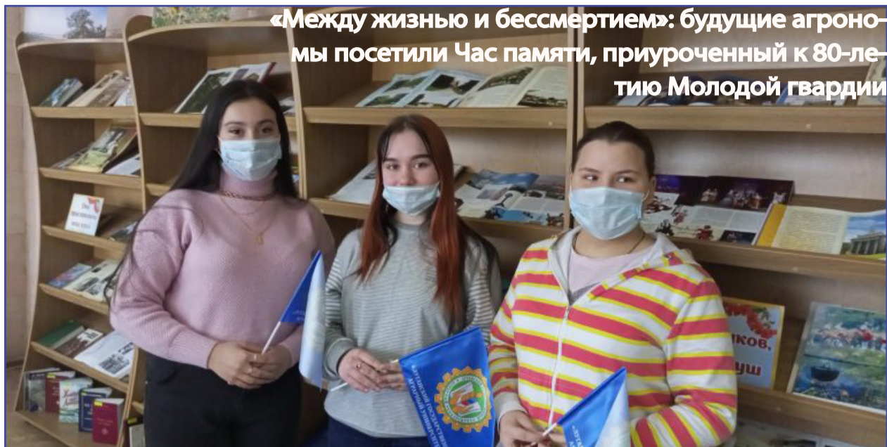
«Между жизнью и бессмертием»: будущие агрономы посетили Час памяти, приуроченный к 80-летию Молодой гвардии

Студенты агрономического факультета 13 января посетили Час памяти, приуроченный к 80-летию создания антифашистской подпольной молодежной организации «Молодая гвардия», который проходил в Луганской молодежной библиотеке.