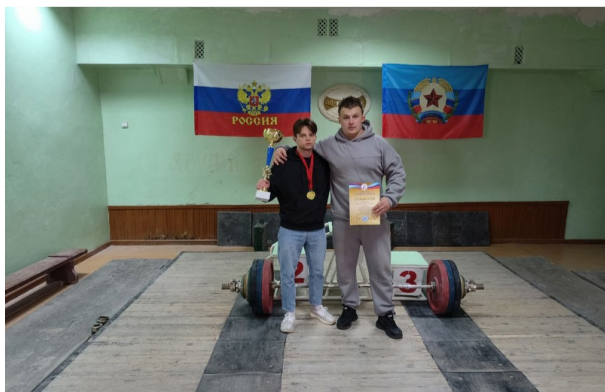
Пресс-центр университета, фото участников соревнования

Поздравляем наших спортсменов с высокими результатами!